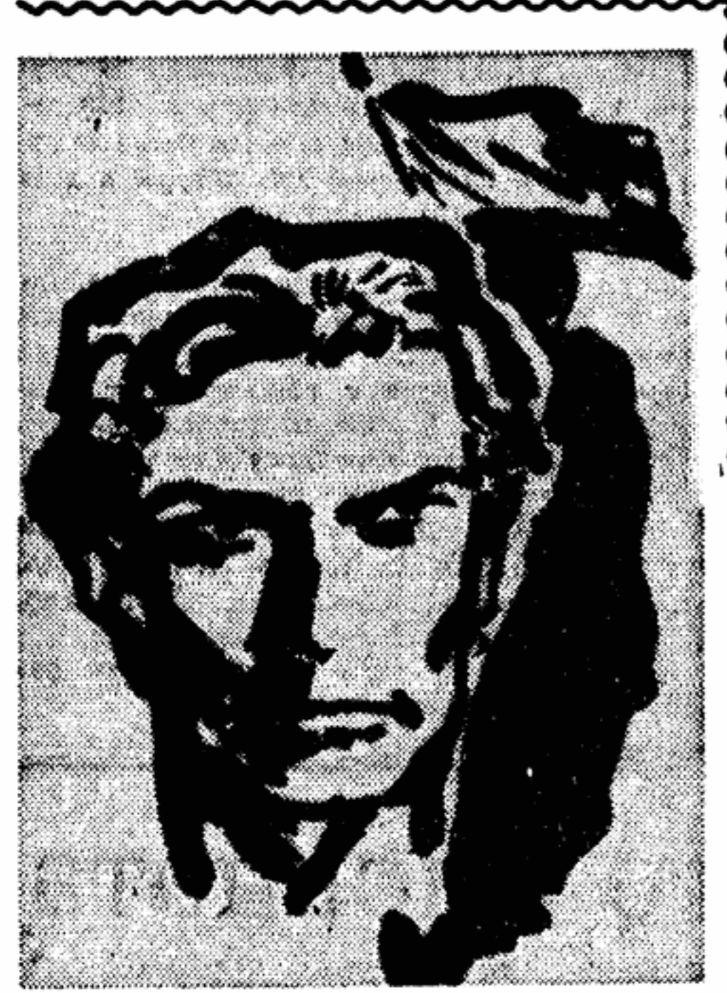
Рис. С. Краускауска

Разговор о качестве одежды продолжен на страницах нашей газеты.